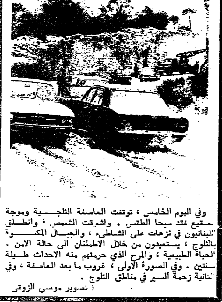
وفي اليوم الخامس ، توقفت العاصفة الثلجية وموجة حتمية فقد صبحا الطقس. واشرفت الشمس ، وانطلق اللبنانيون في نزعات على الشاطئ ، والجبال المكسوة بالثلوج ، يستعدون من خلال الاطمئنان الى حالة الامن - الحياة الطبيعية ، والمرح الذي حرمتهم منه الاحداث طيلة سنتين. وفي الصورة الاولى ، غروب ما بعد العاصفة ، وفي الثانية زحمة السير في مناطق الثلوج

قال السيد احمد اسكندر وزير الاعلام السوري ، ان جميع الصحافيين السوريين الذين ايدوا فرض رقابة صحفية في الاسبوع الماضي ، وبلغ السيد اسكندر مجلة (النداء) في بيروت ، والمسؤولين عن التجاوزات التي كانت وصمة عار في جبين المهنة والتي كانت تجرح المشاعر الوطنية اللبنانية والعربية ، وتسيء إلى قوات الردع العربية التي توجب السروح الوطنية جها وتقديرها . وأضاف يقول : لقد اكادوا في اجتماعات عديدة اخبرنا من مثلي نقابة الصحافيين اللبنانية ونقابة المحررين اللبنانيين ، ان الصحافيين السوريين ايدوا جميعا فرض قانون الرقابة . وقال السيد اسكندر انه يتصور ان مرسوم الرقابة قد صدر لتأمين ان تتم عملية إعادة تمثيل لبنان في جو بعيد عن التعرض والاستفزاز والاشفاق . وقال : اني واثق تماما بان هذا القانون